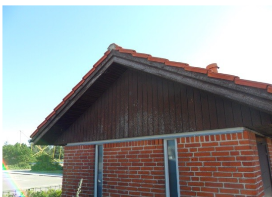
Blåvandvej 29 a, Blåvand by