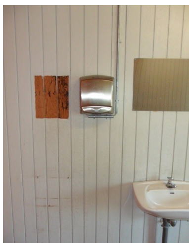
Fyrvej 63 a, Blåvand