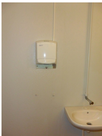
Toilet i Vejers by